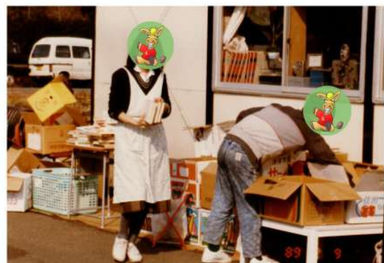
集めてきた古本を整理し、種類別に分けている様子