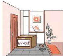
玄関前が難しい場合は、玄関内にご用意下さい。