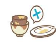
割れたり、汚れのひどい食器はお断りする場合があります。