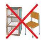
家具全般引き取りが出来なくなりました。