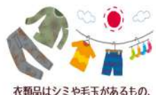
衣類品はシミや毛玉があるもの、壊れたり破れたりしているものはNG 出す前にならず洗濯をお願いします。