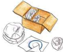
食器などは割れないよう梱包してから段ボールや紙袋に入れて下さい。