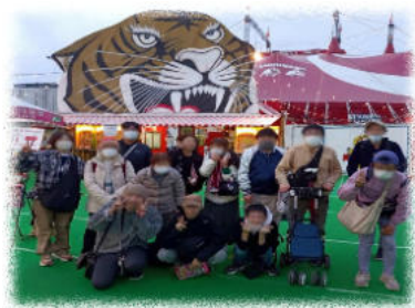
▲「みんな笑顔で最高の一枚」