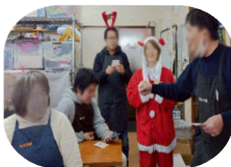
▲かわいいサンタさんも一緒に ビンゴ大会も盛り上がり