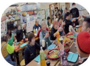
▲笑顔で乾杯！クリスマス会

なっていくのをヤキモキ しながら見ている方もい らっしゃいました。最後 は皆さん景品をゲットし て。とても嬉しそうでし た。(文責 職員 M)