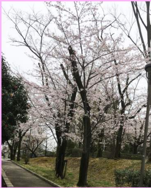
今年の桜は咲き初めが早く、8日の桜祭りに残っている？写真は去年、近所の公園にて

新年度を迎えるにあたり、一番の楽しみは新しい仲間との出会いがあるかどうかということですね。